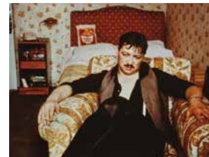
Christian Braad Thomsen DK 2015 106 min

Ja, den er lang, men hvor er den dog fascinerende og velfortalt.